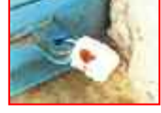
तथा दवाई की खाली बोतल उपयोग