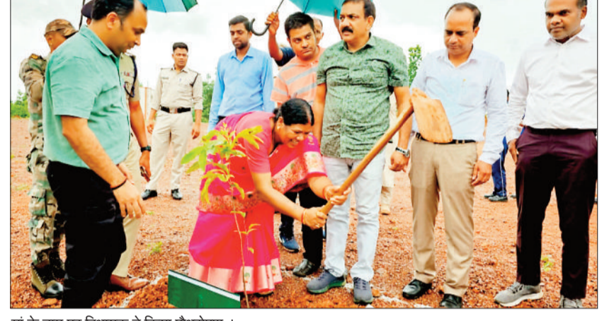
मां के नाम पर विधायक ने किया पौधरोपण।