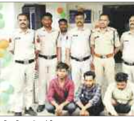
पुलिस गिरफ्त में आरोपी।

घटनाओं को अंजाम देने के बाद अब आ द त न ब द मा श पुलिस विभाग कर रही तलाश को भी नहीं बखस रहे हैं। व तं मा न मामला करंजी चौकी क्षेत्र का है जहां एक जुलाई की रात करीब नौ बजे दत्तमा चौक में सड़क के बीच में जन्म दिन मना रहे मनलले युवकों को पुलिस कर्मी द्वारा सड़क के किनारे होकर जन्म दिन पार्टी मंगाने की सलाह देना नुकसानदेह हो गया, समझाईश देने की बात सुनकर नशे में धुत युवकों ने नाराज होकर प्रधानआरक्षक के साथ गाली गलौज शुरू कर दी, विवाद बढ़ने के दौरान करंजी चौकी की पेट्रोलिंग पार्टी भी मौके पर पहुंच गई, पेट्रोलिंग पार्टी ने